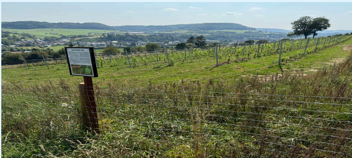
Dikricher Wangerten op Faulert