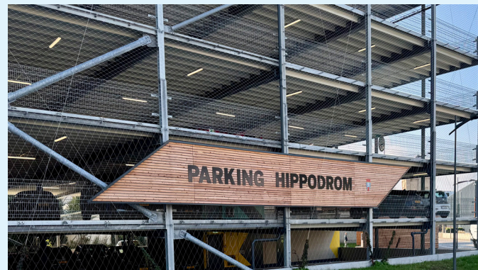
Das neue Parkhaus HIPPODROM