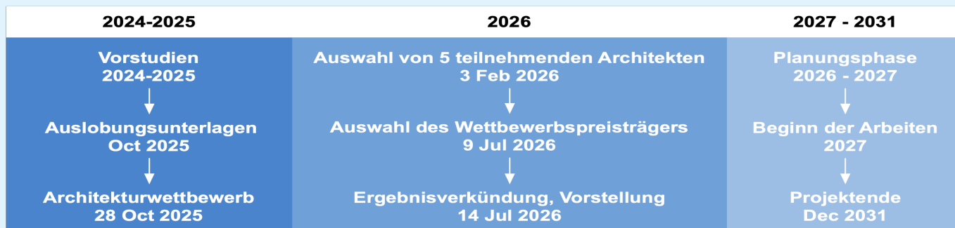
Cronologia do projeto #NeiDiekirch

O planeamento da renovação da Grand-Rue está a avançar bem. Os resultados da consulta aos cidadãos serviram de base para um concurso ambicioso, centrado na qualidade de vida e de habitação, bem como na resiliência. O concurso de urbanismo será lançado no final de 2025. O anúncio dos resultados e a inauguração da exposição do projeto vencedor estão previstos para 14 de julho de 2026.