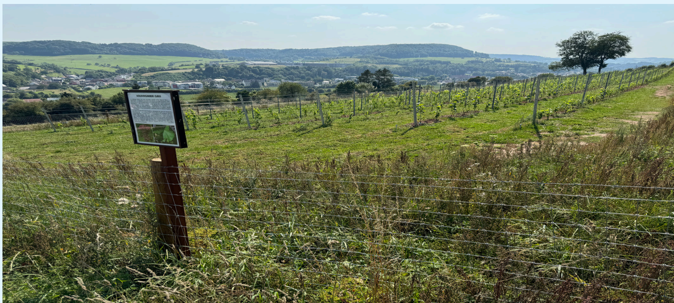
Dikricher Wangerten op Faulert