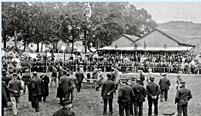
Éischten Hippodrom um Lorentzwues

Após mais de 300 anos, a viticultura foi retomada na encosta sul do Herrenberg. O projeto foi lançado pela associação «Dikricher Wäifrënn» com o apoio da cidade de Diekirch e do Ministério da Viticultura. O objetivo é produzir um vinho proveniente de uma viticultura ecologicamente responsável, que será comercializado como produto regional de Diekirch. O projeto combina assim de forma especial a tradição histórica, a consciência ambiental e o compromisso comunitário..